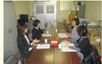
献立委員会の様子