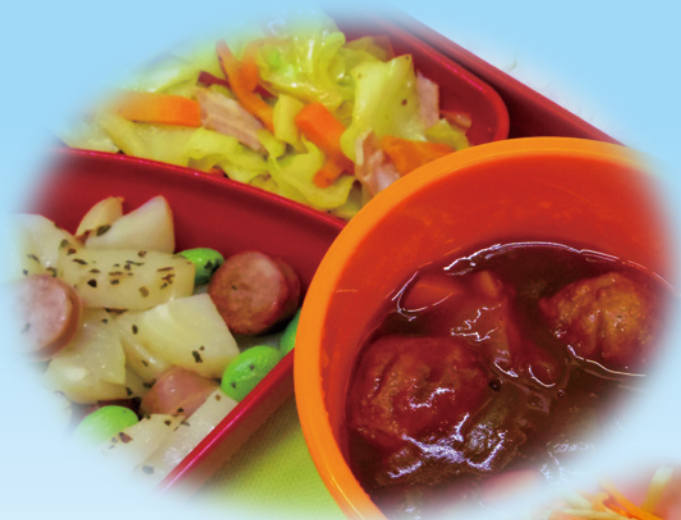
ミートボールシチュー