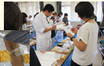
物資選定委員会の様子