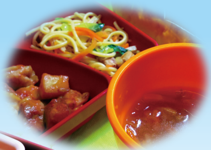
タンドリーチキンポテト